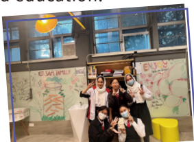
English Ambassadors added their personal touch to the iZone

Our Open Day at the English iZone was a resounding success! Families enjoyed a variety of engaging activities designed to promote wellness and creativity. Participants had the opportunity to create personalized wellness bookmarks, allowing them to express their artistic flair while emphasizing the importance of mental health and well-being. Additionally, the wellness picture matching game challenged attendees to connect images with positive affirmations, fostering a fun and interactive learning environment. It was wonderful to see parents and children collaborating and sharing their insights, making the day a memorable celebration of community and education.