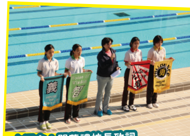
水運會：開幕禮校長致詞

比賽當天，同學們表現得非常雀躍，投入其中。水運會提供了難得的學習機會，除了運動員，還有裁判、工作人員、啦啦隊、社職、制服團體等，所有師生各司其職，互相配合，充分展現了團隊精神，確保了水運會的順利進行。