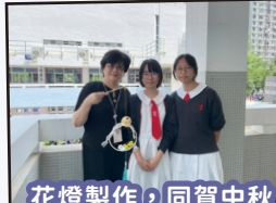
花燈製作，同賀中秋。

中秋，是一個廣受重視傳統節日，而花燈製作技藝是香港的非物質文化遺產，兼具藝術和歷史價值。本學年特意讓學生籌辦中秋非遺文化工作坊，讓學生體味花燈的製作過程，而我們潔心女兒亦藉以發揮創意，製作自己獨特的花燈。當天校園上下充滿歡愉的空氣，彼此祝福，瀟灑中秋的團圓喜慶之意。