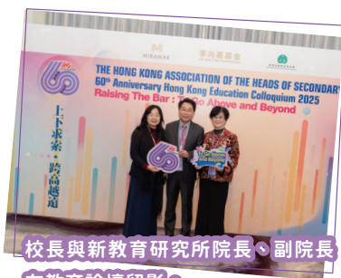
校長與新教育研究所院長、副院長在教育論壇留影