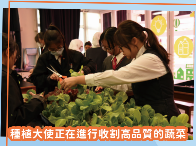
種植大使正在進行收割高品質的蔬菜