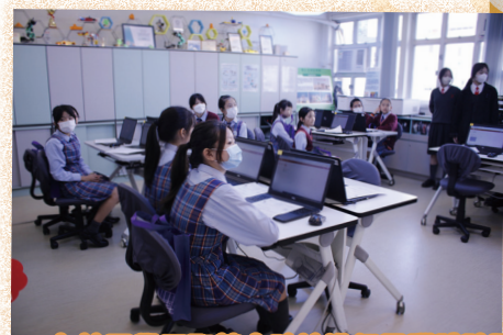
友校同學正聚精會神地進行電腦體驗課