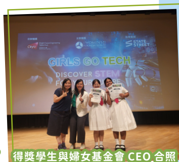
得獎學生與婦女基金會 CEO 合照