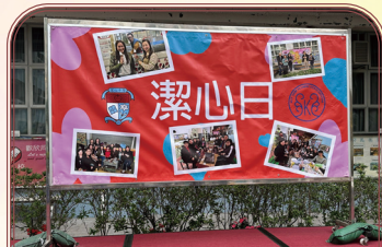
「潔心日」在十二月第一個星期六舉行，是校友的 Homecoming Day。