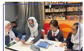
Students worked together to create a story using four pictures

The recent English Society featured an exciting blend of creativity and collaboration! Students participated in a picture boarding activity, where each group of four was given a unique image alongside thought-provoking questions on the back. Working together, they crafted imaginative stories inspired by their pictures, encouraging teamwork and innovative thinking. The variety of narratives that emerged showcased the students' creativity and ability to interpret visual prompts in diverse ways. It was a fantastic opportunity for them to enhance their storytelling skills while bonding with their peers. Well done to all the groups for their imaginative contributions!