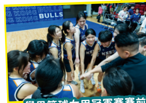
學界籃球女甲冠軍賽賽前振奮士氣