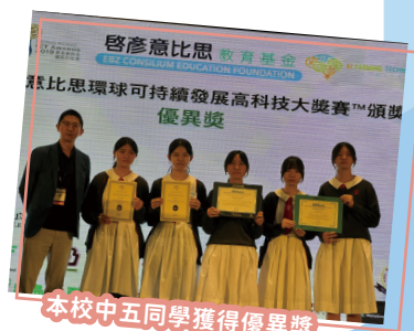
本校中五同學獲得優異獎