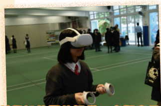
科學組的攤位提供了虛擬實景的體驗活動，讓同學感受科技為生活帶來的便利。

本年度的學藝薈萃以聯合國可持續發展目標「良好健康與福祉」及教育局對「推廣學生的精神健康」的關注為主題，旨在探討健康的生活方式，強化人類住區規劃和管理能力，冀能喚起同學及社會大眾對可持續發展的認知和關注。當日活動豐富多彩，各個學科攤位由高中同學悉心設計，與初中和小學同學分享她們的學習成果和體驗。