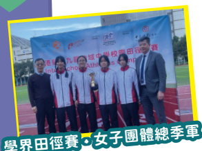
學界田徑賽：女子團體總季軍