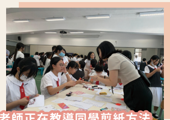
老師正在教導同學剪紙方法

剪紙藝術作為中華傳統文化的重要組成部分，歷史悠久、形狀各異，常常用於節慶裝飾和祝福。中華文化日準備了十二生肖的剪紙活動，透過學習簡單的剪紙技巧，同學能夠創作出屬於自己的生肖剪紙作品，體驗到手工藝的樂趣與成就感，以及了解每種生肖的特徵與意義，加深對中華文化、傳統習俗的了解和認識。