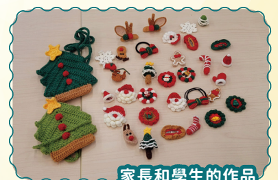
家長和學生的作品