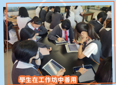
學生在工作坊中善用 Goodnotes 摘錄課堂重點