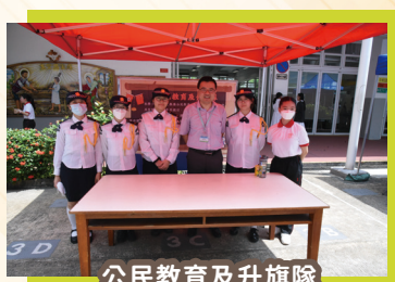
公民教育及升旗隊