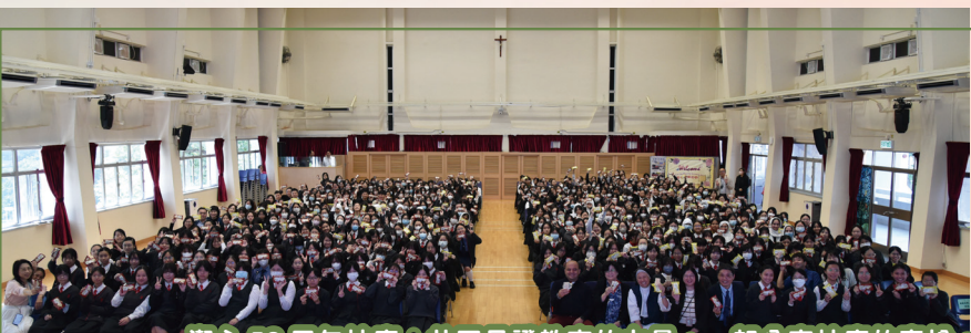
潔心 53 周年校慶：共同見證教育的力量，一起分享校慶的喜悅。