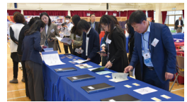
本校導學案及教學材料獲考察團高度評價

整個參訪活動得到內地校長團的高度評價，除認同本校的辦學理念、自主學習的發展外，亦肯定了我們潔心女兒喜樂的校園生活、豐盛的學習成果、賦能的正向教育。