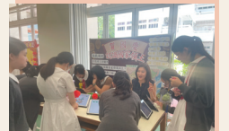
老師與同學就著不同的省份配對進行互動

「賀國慶 · 認識國家領土」攤位遊戲活動，不僅增進了同學的國家地理知識，還促進了校內的文化交流。活動吸引了同學積極參與，在攤位前踴躍配對國家的不同省份、自治區、直轄市、特別行政區，挑戰自己的地理知識，氣氛熱烈。活動的設計讓同學學習國家不同地方的特色、以及彼此之間的互動關係。