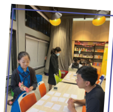
Our teachers actively participated in the games too