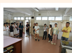
家長、學生參觀家政室。