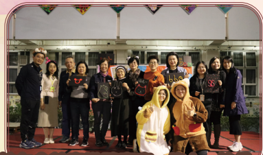
校友會幹事邀請嘉賓、修女、校長、老師們拿著閃爍的燈牌為潔心日揭開序幕。