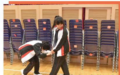
穿上體驗衣，一同感受長者的限制。

同學在活動後更利用網上平台 LMS 系統，讓學生上載個人小善幸及對主題的反思。整個計劃利用 P.I.E 策略讓學生能夠通過「策劃」、「行動」及「反思」體驗及學習義工服務工作及意義，達至課堂以外自主學習的精神。中二級同學於下學期更會延續上學期所學，於全方位學習周時參加由輔導組舉行的長者義工服務，為長者提供服務。