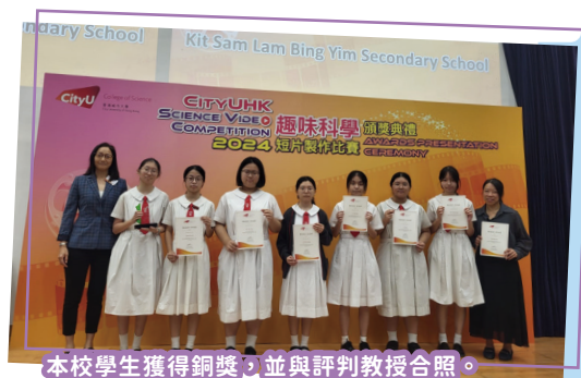
本校學生獲得銅獎，並與評判教授合照。

經評審團嚴謹評核後，選出 9 條短片，我校隊伍以主題「糖在烹調上的神秘面紗」勇奪銅獎，肯定了同學一直的付出和努力。