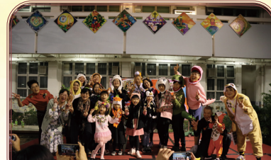
參加者扮演不同動物，角逐優「獸」校園服裝獎。