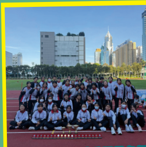
學界田徑賽：團體季軍是各個隊員一分一分的拿回來的！

雖然獲得不同的獎項值得慶祝，但最令人感動和難以忘懷的，是各隊員在比賽場上拼搏的精神、看台上熱烈的打氣聲，以及大家互相扶持、互相鼓勵的動人舉動。希望這些美好的畫面能在學界越野賽中再次上演！