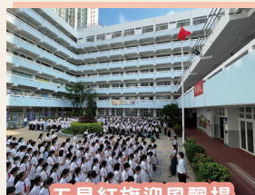
五星紅旗迎風飄揚