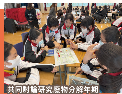
共同討論研究廢物分解年期