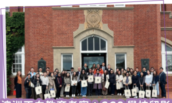
澳洲正向教育考察：GGS 學校留影