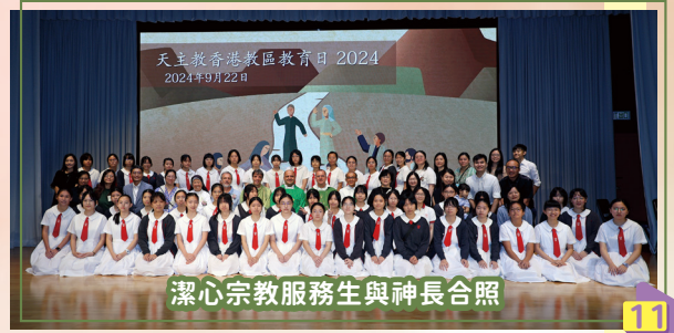
潔心宗教服務生與神長合照