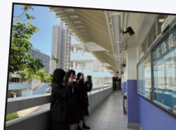
驛動校園，錘鍊佳句。

杭州雅扇自古聞名海內，清代光緒元年的王星記扇莊，憑藉精良的做工和獨特的工藝在眾多店家中脫穎而出，經過不斷發展，王星記扇終於成爲杭扇的代表。本學年的華夏文化體驗活動，亦通過拓印、描摹等方式，輔以學生的創意思維能力，製作屬於自己獨一無二的紈扇。