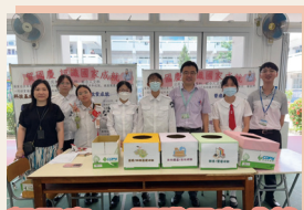
賀國慶。認識國家成就

國家自改革開放以來，在不同領域都取得了令人可喜的進步和成就，透過攤位遊戲、壁報展板，讓學生進一步認識國家的不同成就，包括：「基建成就」、「醫療成就」、「高新科技」、「文化遺產成就」、「科技基建成就」、「脫貧成就」、「教育成就」和「文化成就」。