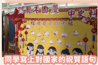
同學寫上對國家的祝賀語句

在紅燈籠下的祝福活動，旨在慶祝中華人民共和國國慶七十五周年，讓學生們通過傳統手工藝，表達對祖國的祝福和期望，增進了對中華文化的理解與認識。高中學生為全校