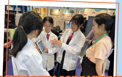
水耕種植大使積極向公眾展示水耕學習成果

為培養學生 STEAM、綠色科技和社會創業技能，通過校園內外的實踐和分享，豐富學生學習經歷，提升提問、應變及解難能力，本學年在中四級和中五級於生物科、電腦科和經濟科推行智慧農場跨學科計劃，並於生物室設置環控智能水耕種植系統，讓學生了解如何透過科技及平台遙距監測和控制，種出蘊含極豐富營養價值的蔬菜及香草；收成將會作營商和慈善用途。是次計劃讓學生學習和應用生物科、科技科及經濟科的跨學科知識，並以學習成果回饋社會，支援社區中的弱勢社群。計劃於本學年 10 月展開，100 名學生參與種植大使的相關培訓，於校內進行水耕種植，學習如何引入科技進行農業種植和學習社會創業的技能。