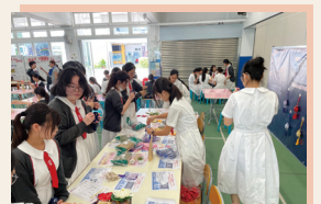
閒情雅趣，陶冶性情。

香囊是中華文化、女性閨閣生活中極具代表性的物品之一，製作香囊時的每個細節都不容輕視，從外的設計縫製，到內的香料調配，增添生活的雅趣外，亦充分反映推究藝術的極致。是次工作坊挑選了薰衣草、艾草、檀香等材料，然後製成香囊。香囊的製作過程不僅體現了潔心女兒的巧手慧心，香囊成品同時把中華文化精髓如縷縷清香散發出來，存留於眾人的心坎之中。