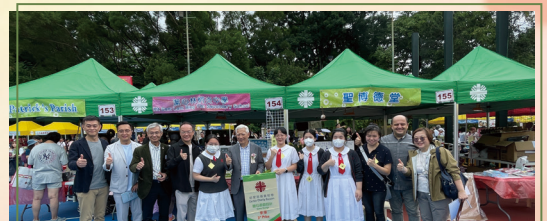
負責設計遊戲的同學從頒獎嘉賓手中接受錦旗

當天，許多參加者、家長和小朋友都駐足觀賞我們的攤位，享受遊戲並拍照留念。同學的努力和堅持不僅為活動增添趣味，更賦予了遊戲深刻意義，啟發參加者。