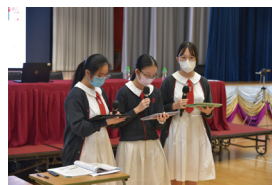
在課堂中學生分享小組共學學習成果