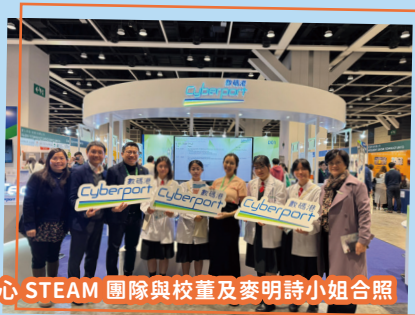
潔心 STEAM 團隊與校董及麥明詩小姐合照