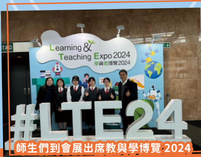
師生們到會展出席教與學博覽 2024