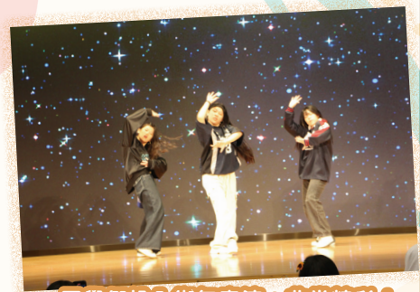
同學們投入街舞表演，非常精彩！

中學學科自主學習體驗課是最受歡迎的體驗活動之一，讓小學同學有機會進入教室或特別室，參與由本校老師教授的科學、電腦、數學、家政、體育、和視藝科等自主學習的課堂，體驗互學、共學及朋輩互助的學習模式，課堂氣氛熱熾。本校一共舉辦了4場體驗課，參與的學生更高達200多人。各科體驗課內容豐富：科學科安排同學參觀