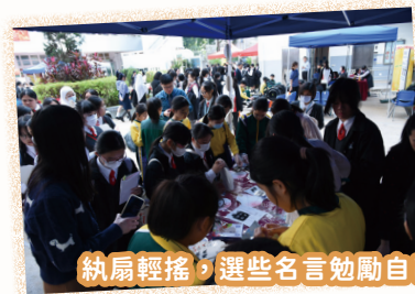
紈扇輕搖，選些名言勉勵自己！

學科攤位各具特色，均設置各種趣味互動遊戲，涵蓋科技、語文及體藝等學習領域的活動。同學活學活用，親自設計及製作了「Empowerment through Expression」、「香茗細品 紈扇輕搖」、「賦能·心繫家國·豐碩生活」、「玩轉香港 尋找快樂」、「展開靈性修煉的幸福之旅」、「有『營』生活」、「VR 放鬆體驗區」、「喜逆同行」、「強身強心」、「藝術連結你我·促進身心健康」等多個學科攤位及展覽，把日常所學化作既有趣味又具濃厚學術性的活動，充分展現潔心女兒的才華和創意，豐碩的學習成果可見一斑。除此之外，我們還安排了音樂及舞蹈表演、智慧農場成果展示、校園導賞等精彩節目，百花齊放，讓來賓感受到校園的文化氣息和活力。