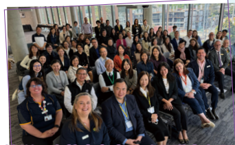
澳洲正向教育考察：社區議會留影