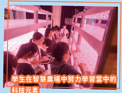
學生在智慧農場中努力學習當中的科技元素