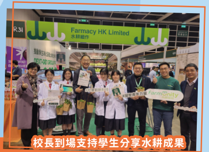
校長到場支持學生分享水耕成果