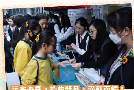
玩完遊戲，換些獎品，滿載而歸！

在陽光普照、熱鬧繽紛的氣氛下，是次活動圓滿結束，獲得嘉賓、學界、坊眾廣泛迴響，對本校的教育理念和教學質素表示高度讚賞和肯定，並對本校的師生表達了感謝和祝福。我們亦藉這次活動啟發中、小學生、家長和公眾人士對可持續發展目標的認識，共同支持智慧城市的發展，並由自身做起，活出永續生活。