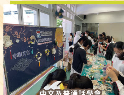
中文及普通話學會

為讓同學了解各個學會，活動及潛能發展組特別於 9 月 12 日至 13 日舉辦「學會展示暨精神健康推廣日」，一眾學會幹事在這兩天齊集花園及雨天操場，努力向同學推介自己的學會，除了增進同學對學會活動的參與度、了解和興趣外，精神健康日攤位的展示板和互動遊戲，亦使學生了解精神健康的重要性，學習有效應對壓力和情緒管理的技巧，從而提升他們的心理健康水平。當天校園非常熱鬧，校園每一個角落都彰顯著學生們的活力和熱情。