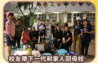
校友帶下一代和家人回母校

「潔心日」定於每年十二月第一個星期六，是潔心傳統的 Home Coming Day。今年 12 月 7 日校友會舉辦了「潔心日 2024 聯歡燒烤暨校友會周年大會」，百多位校友、榮休老師、校友會顧問、修女和老師等齊集母校，令星期六晚上的校園非常熱鬧。首先，校友們參加校友會周年大會，通過會務報告及會章修訂。接著，榮譽顧問劉校長向校友簡介母校的近況，呼籲校友繼續支持母校的發展。在戴修女領禱及全體唱校歌之後，聯歡燒烤正式開始。大家一邊圍爐燒烤，一邊交頭接耳，緬懷在潔心成長的故事。燒烤過後，嘉賓選出最配合優「獸」校園服裝主題的朋友，上台展示自己精心打扮的動物造型。當聽到雪糕車的音樂，大家就排隊領取冰淇淋，細味甜絲絲的滋味和濃濃的情誼。一輪大合照後，「潔心日」就在歡笑聲中圓滿結束。潔心女兒，明年再會！