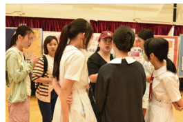
校園大使與家長、學生交流。