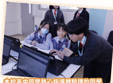
本校高中同學熱心指導體驗課的同學

本校新設的「智慧農場」，讓她們嘗試在農場中進行育苗和移苗種植過程，並即場製作一些小型盆栽，同學可帶回家體驗種植的樂趣。期間本校的種植大使分享了可持續發展的概念、栽種植物的心得及當中相關的生物科知識；電腦科則採用 CoSpaces 平台讓同學製作 AR (Augmented Reality——擴增實境) 動畫。同學透過 AR 技術，利用攝影機影像的位置及角度精算，加上圖像分析技術，讓螢幕上的虛擬世界能夠與現實世界場景進行結合與互動的技術；數學科以「尋找幸福寶藏」為主題，透過參與老師設計的 Desmos Classroom 活動遊戲，從中認識直角坐標系統和坐標的概念，同學以小組協作方式去解開幸福寶藏的密碼；家政科讓同學自己製作健康美味的「雞蛋焗薯蓉」，期間更向同學分享健康飲食的重要性。同學完成後，可即時與家人和朋友一同分享美味的製成品，充滿喜樂；體育科則安排同學體驗室內賽艇機，期間同學可以進行賽艇競賽，透過活動也希望能讓參與者以有趣方式強健體魄；視藝科以「藝術連結你我」——促進身心健康 (Be Together——Empowering Well-being with Arts) 為主題，同學製作一些毛絨鐵絲花手工及進行拼圖遊戲。透過活動，讓她們了解更多印象派畫家的想法，讓大家都都能接納不同人士的想法及行為。