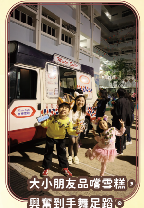
大小朋友品嚐雪糕，興奮到手舞足蹈。