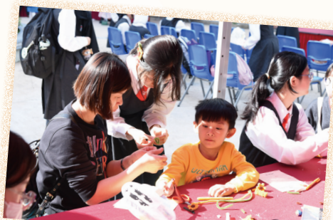
家長和小孩一起製作藝術作品！

此外，本年度學藝薈萃以「生成式人工智能圖文創作」作為主題比賽，讓小學及初中同學利用人工智能生成式工具，創作「我最喜愛的寵物」圖像，比賽反應熱烈，作品均能展現創意、關愛及滿滿的幸福。