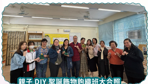
親子 DIY 聖誕飾物鉤織班大合照

本會亦於 11 月舉辦了親子 DIY 聖誕飾物鉤織班，活動受到家長及同學的歡迎，透過鉤織聖誕飾物時的交流互動，提升彼此的了解，有效加強及促進親子關係。下學期，本會將陸續舉辦其他不同的興趣班、家長教育工作坊、親子一日遊等活動，敬希家長留意通告並踴躍參與。