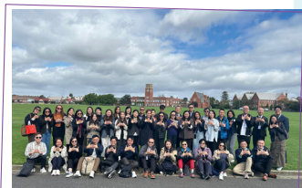
澳洲正向教育考察：GGS 學校留影