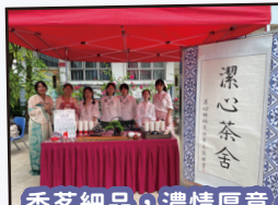
香茗細品，濃情厚意。