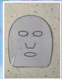
獲獎發明製品：面膜