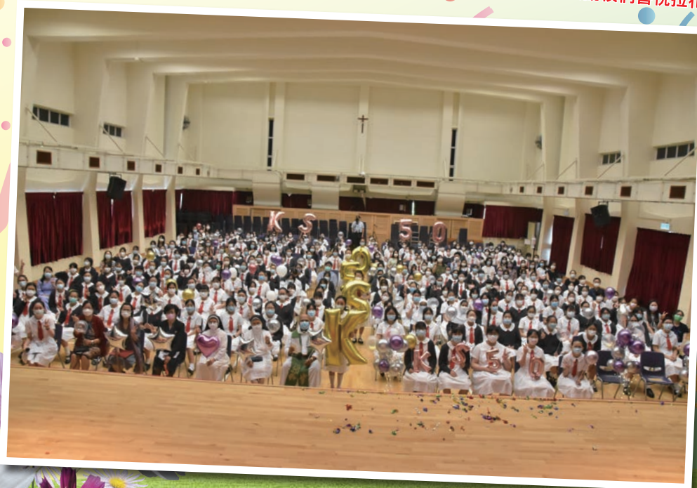
潔心校監、校長、莊神父及師生們大合照