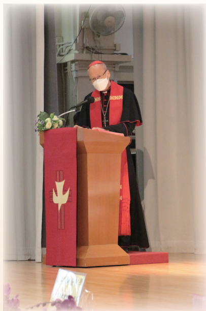
校園建設祝福禮湯漢樞機講道

感恩祭後兩天，2021年12月10日，另一個五十周年慶祝活動隨即舉行，那就是校園設施祝福禮。祝福禮由湯漢樞機主禮，陳鴻基神父及孫英峰神父襄禮，禮儀中，樞機為校園內新建設的宗教設施—「恩臨牆」及「玫瑰四驛」作祝福祈禱。