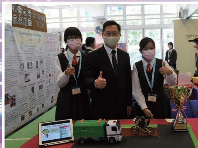
創新科技局長薛永恒讚賞「單車精明眼」設計