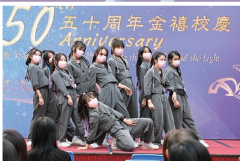
潔心女團婀娜多姿，熱情奔放