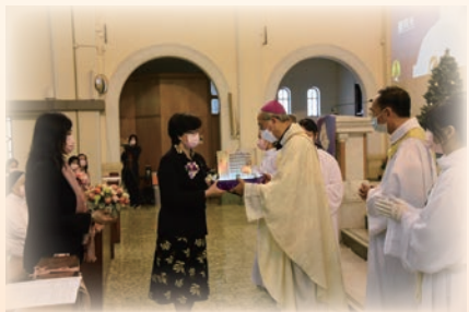
奉獻由在校學生及校友合作製成的校舍模型