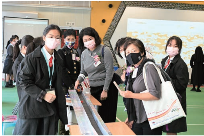
用3D打印磁浮列車模型

其他學習領域也同樣精彩，如人文學科方面帶領大家穿梭古都。中國歷史科讓來賓穿上漢服並配戴飾物，搖身一變成為古人，透過VR技術欣賞《清明上河圖》，體驗古人生活。數理領域的攤位也獨具匠心，如數學科攤位展示了立體屋，仿照現今房屋的佈局活展生活面貌。藝術及體育領域則展現了無限創意，如視覺藝術科就教來賓以定格動畫拍攝方法拍攝動畫影片。