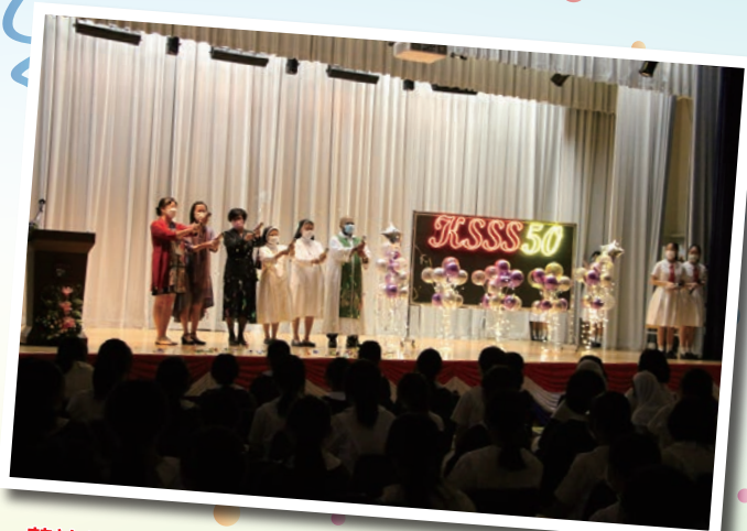
莊神父與校監、校長及副校們喜悅拉花炮及進行亮燈儀式