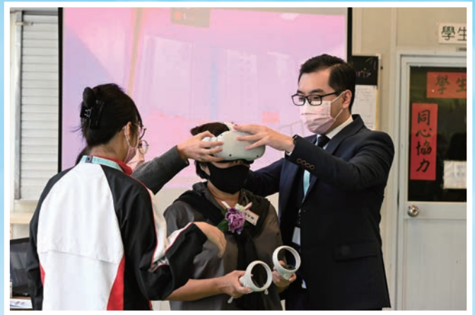
戴上VR眼鏡暢遊校園

另外，健康管理與社會關懷科邀請來賓戴起 VR 眼鏡扮演長者完成任務，教人反思長者的困難，鼓勵我們以創新思維幫助長者，服務社會。而企業、會計及財務概論科讓來賓學習妥善理財，建立個人財務規劃，以實現人生目標。家政科在3D食物列印機預先載入食譜，來賓只需透過電腦、手機或其他科技產品，便可遠端設計出自己專屬的食物，十分有趣。