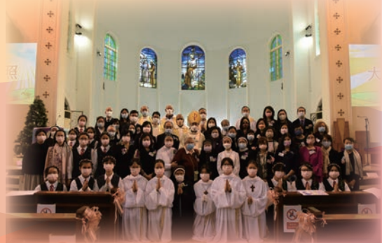
主禮、共祭神父 嘉賓及禮儀負責同學合照