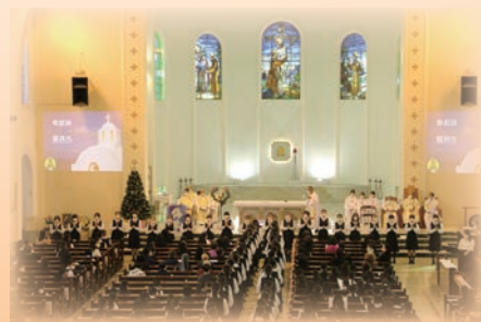
中六同學獻上禮儀舞

「恩臨牆」是由學生與製作公司合力製成的馬賽克壁畫，提醒我們聖神的恩賜充滿了學校，祈求聖神給大家力量，承行上主的旨意，發光發亮。