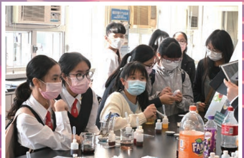
來賓在化學室製作分子料理，樂在其中