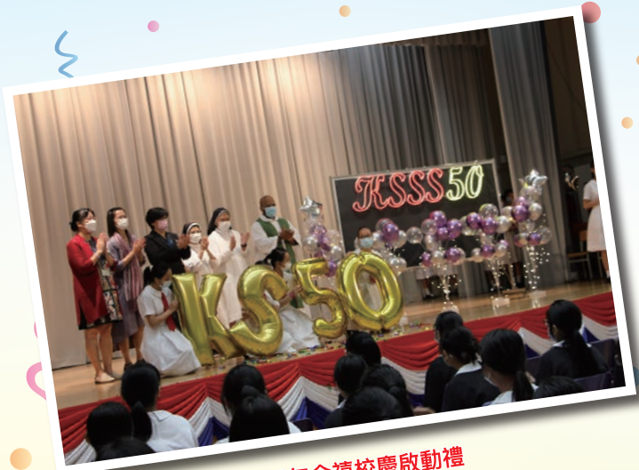
50周年金禧校慶啟動禮

接着，由學生介紹潔心五十周年校慶的主題「慶金禧、展異彩、創新貌」，師生藉此慶賀學校的大生日，並展現同學的才能，為學校帶來新氣象。一段回顧學校歷史和發展的短片，讓師生回顧學校的成長故事。接著，莊神父、修女、校長及兩位副校長一同拉花炮，「KSSS 50」的光芒便綻放人前，歡欣的歌聲在禮堂流竄，師生揮舞汽球，雀躍地歡呼，為五十金禧校慶揭開序幕。