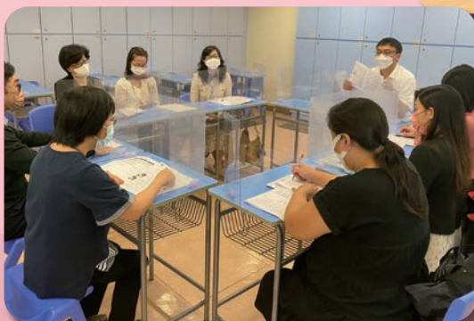
劉校長與老師一同進行會計科的議課