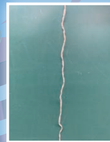
獲獎發明製品：人造纖維