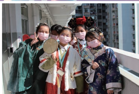
中史科同學扮演古人，向來賓介紹不同漢服