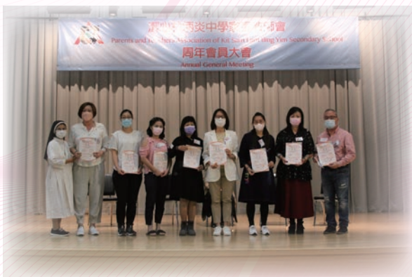
修女頒發家長義工獎狀

家教會亦已舉辦家長電子平台班，協助家長熟悉本校內聯網的使用。在下學期，家教會將陸續舉辦興趣班、家長教育工作坊、親子一日遊等，敬希家長留意該會的通告並踴躍參與。