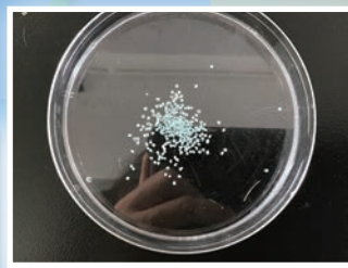
獲獎發明製品：環保微塑膠粒