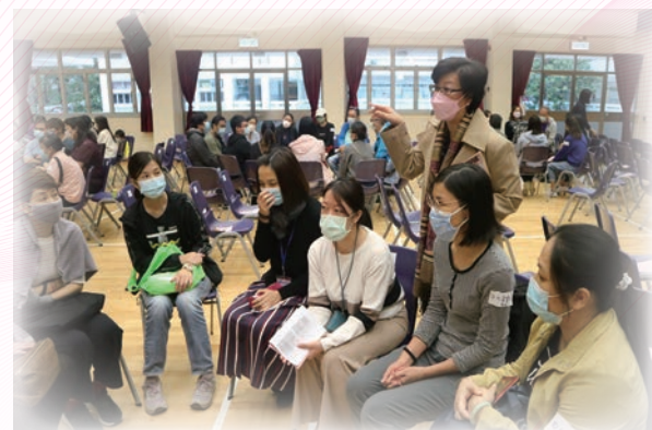
校長與中一級家長暢談