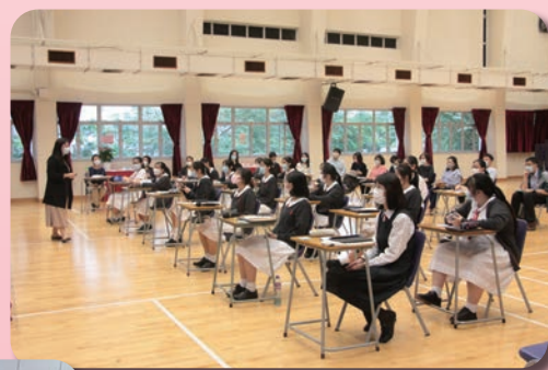
陳老師和同學在禮堂進行英文公開課