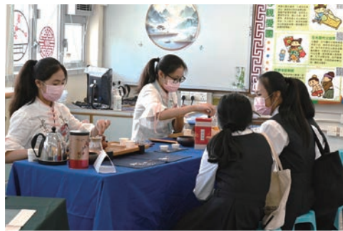
中文學會的茶藝大使以茶會友