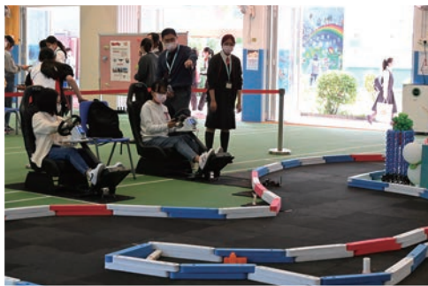
TR遙感現實技術讓來賓體驗虛擬駕駛的樂趣

潔心師生共創 e 世代的學習模式，緊貼時代的轉變。兩天的活動在喜氣洋洋的氣氛下圓滿結束，潔心師生把握學習機會，結合創新科技，力求進步，從來賓的讚賞充分體現同學的學習成果，且深刻地回應了校慶主題「慶金禧、展異彩、創新貌」，為培育下一代竭盡所能，不遺餘力。