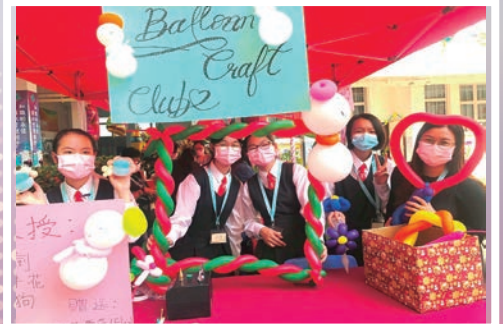
氣球學會的佈置燦爛繽紛，賞心悅目