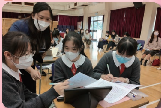
曾老師和同學在禮堂進行中文公開課，學生專心上課

祈盼在往後的日子，我們能以不同的方式與學界同工互相觀摩交流，攜手為學生提供更優質的教育。